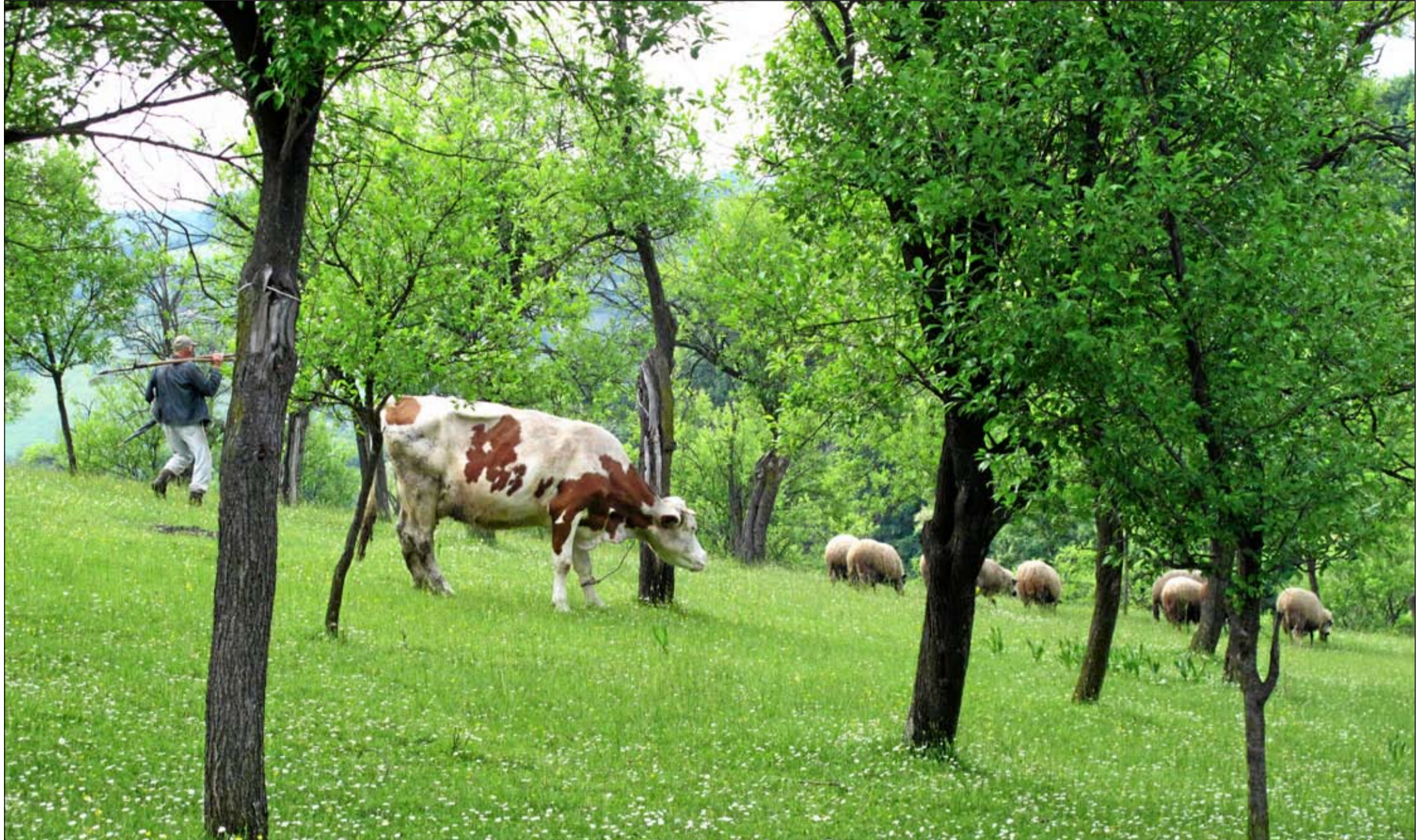
Serbian maaseudulla moni pitää muutamaa kotieläintä omiksi tarpeikseen.