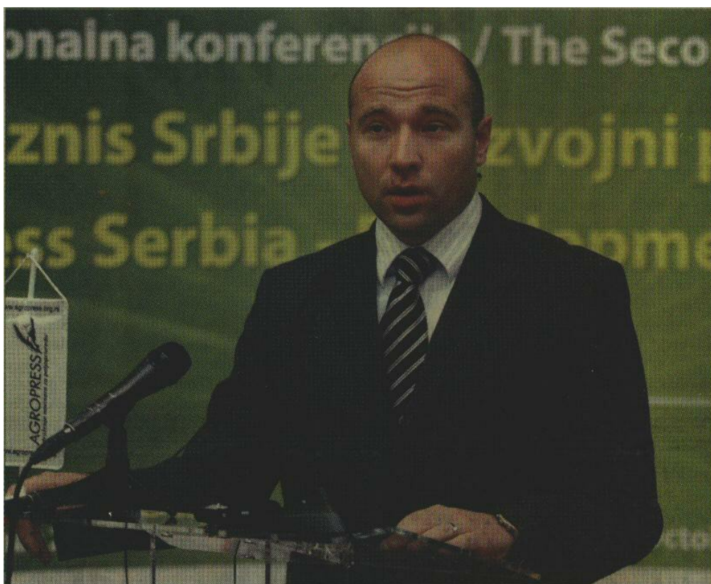
Prošlogodišnji rezultati poljoprivredne proizvodnje govore sami za sebe

Ministar poljoprivrede, šumarstva i vodoprivrede Saša Dragin izjavio je juče da poljoprivreda nije generator krize nego njeno rešenje, „verovatno u ovom trenutku jedino za Srbiju“. Dragin je, otvarajući drugu Nacionalnu konferenciju „Agrobiznis Srbije - perspektive razvoja u 2011.“, rekao da je najbolji pokazatelj da agrarni budžet treba da bude povećan - to što se jedan dinar uložen u poljoprivredu državi vraća „kao pet dinara, a u slučaju pojedinih poljoprivrednih kultura, čak i deset dinara“. „Poljoprivreda je već iskorišćena razvojna šansa Srbije, što najbolje dokazuju rezultati koje je poljoprivredna proizvodnja postigla u prethodne dve godine“, naglasio je ministar i podsetio da je 2009. srpski agrar zabeležio izvoz vredan dve milijarde dolara, sa suficitom od 650 miliona dolara. „Sem vojne industrije, nijedna druga privredna grana ne može se pohvaliti ovakvim rezultatima“, rekao je Dragin, napominjući da je već u prvoj polovini ove godine prošlogodišnji izvoz premašen za 25 odsto. On je dodao da se može očekivati da do kraja ove godine izvoz od agrara dostigne vrednost od tri milijarde dolara, a suficit možda bude čak i dupliran u odnosu na lane. „S dru-