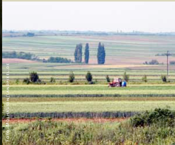
SAMENSTELLING: JACQUES VAN OUTRYVE

Het land en zijn leiders werden verguisd. Het werd gebombardeerd. Het staat vandaag echter zelf op een kruispunt. Van zijn landbouw en landbouwers wordt veel verwacht. Die landbouw is echter aan modernisering toe. Wie neemt de leiding op zich? De Servische overheid of private bedrijven, want landbouworganisaties zijn er (nog) niet. Hierna volgt een verhaal over een land met een landbouw in transitie.