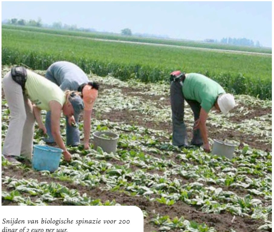
Snijden van biologische spinazie voor 200 dinar of 2 euro per uur.

De Servische overheid geraakte 10 jaar geleden bijzonder geïnteresseerd in de biologische landbouw en zag een opportuniteit voor de Servische biologische producten op de internationale markt. Daar speelt de arbeidskost in het voordeel van Servië. Op de binnenlandse markt is dit een nadeel. De nationale overheid trok onlangs de steun aan de biologische landbouw op naar 360 euro/ha. Noteer dat de conventionele landbouw 140 euro/ha krijgt. Een bedrag dat de nieuwe landbouwminister ook zou willen optrekken, al heeft die zijn zinnen eerder op de dierlijke productie gezet. Die 140 euro is echter geplafonneerd tot 50 ha per bedrijf. De steun aan de biologische landbouw is